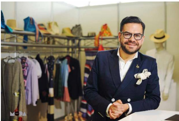
El diseñador en su stand de la Feria de Moda de Tenerife

El Cónsul de Colombia estuvo en la inauguración del evento donde tuvo la oportunidad de compartir con estos diseñadores que además de calidad y talento, coinciden en su responsabilidad y consciencia social y cada uno de ellos tiene una fundación con la que trabajan con distintos colectivos en peligro de exclusión social.