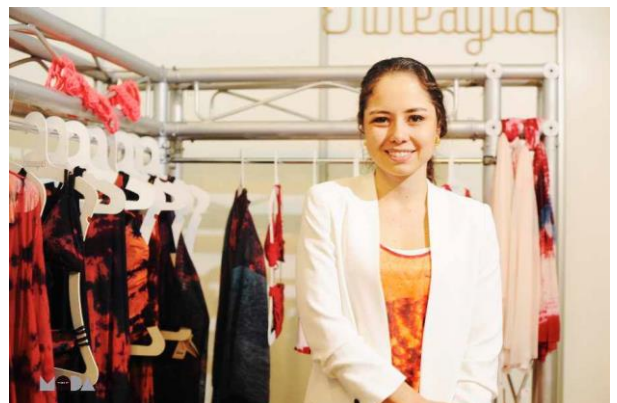
La diseñadora en su stand de la Feria de Moda de Tenerife

Por esto, Entreaguas es una marca colombiana que no solo promueve el trabajo artesanal, sino que también tiene un compromiso social y ambiental.