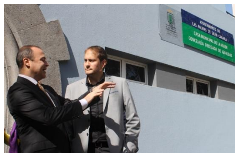
El Alcalde de Las Palmas de Gran Canaria dialoga con el Cónsul de Colombia