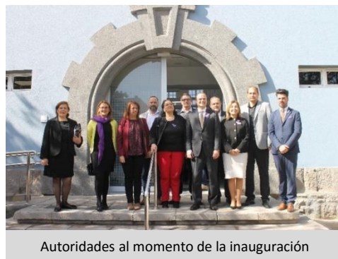
Autoridades al momento de la inauguración

Una vez más el Consulado de Colombia en Las Palmas de Gran Canaria, reivindicó su sensibilización especial a la problemática de violencia de género.