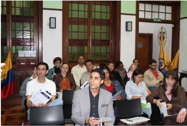
Aspectos de la charla en la sede del Consulado