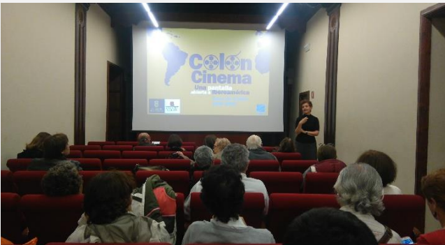
Aspectos de la proyección de la película en la Casa Colón

Gracias a la colaboración del Consulado en Las Palmas de Gran Canaria con los organizadores del ciclo de cine “Colón Cinema - Una ventana abierta a Iberoamérica”, se proyectó el 23 de febrero de 2017 la película “Los viajes del viento” del director colombiano, Ciro Guerra, en las instalaciones de la Casa Colón.