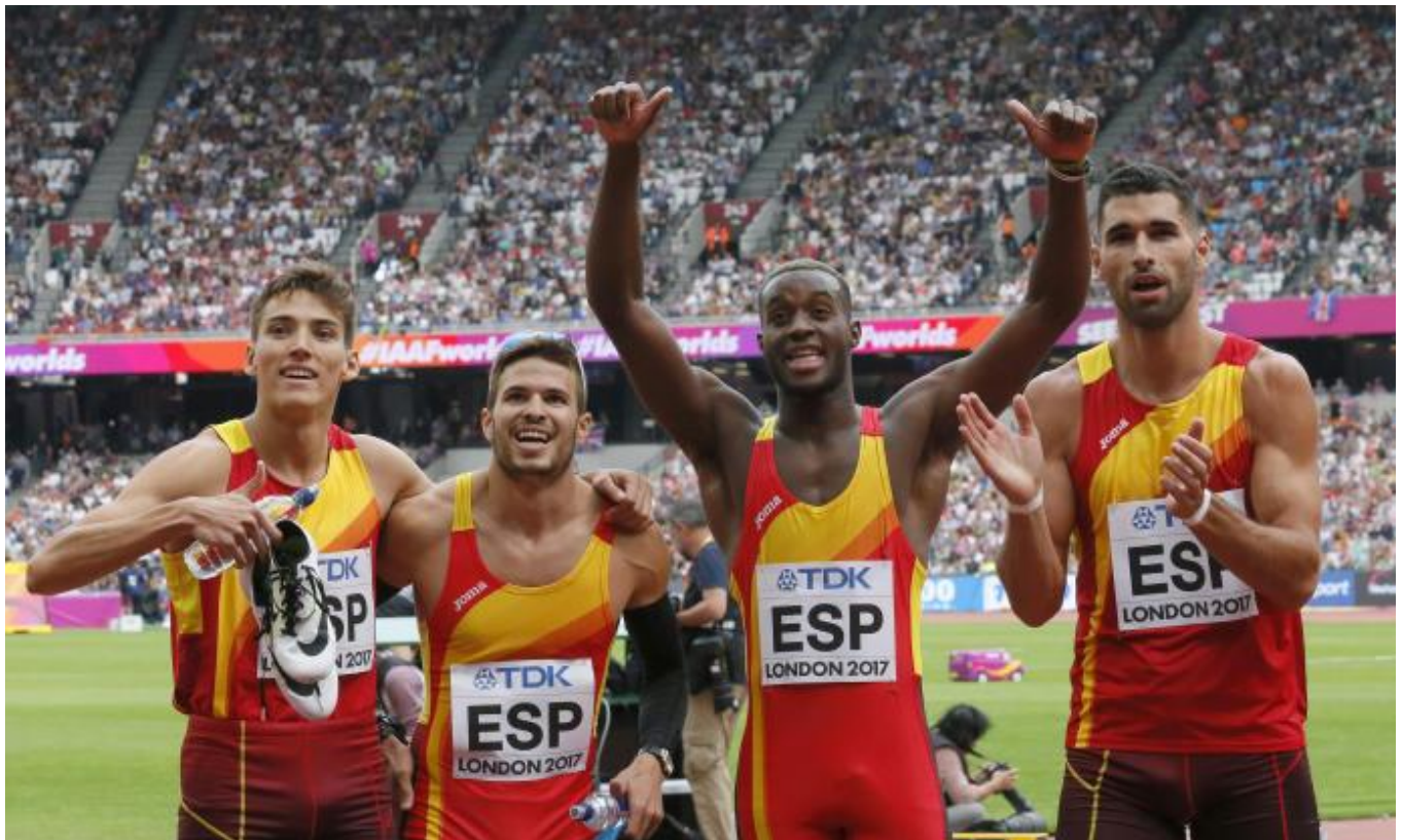
Equipo Español en la prueba 4x400 en los Mundiales de Atletismo de Londres 2017.