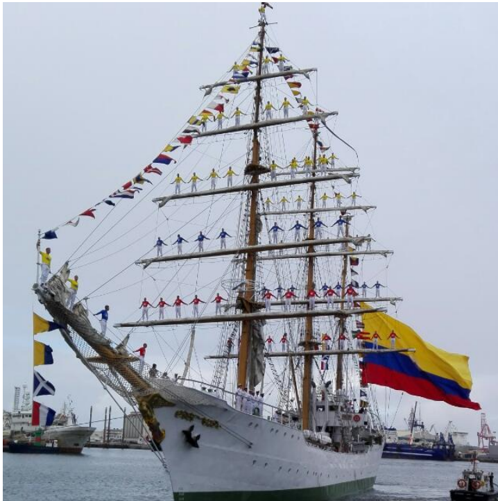
Salida del buque de Las Palmas

Agradecemos a la comunidad colombiana en Canarias su masiva participación en las actividades desarrolladas, con motivo de la visita del Buque Escuela ARC Gloria a Las Palmas los días 9, 10 y 11 de septiembre.