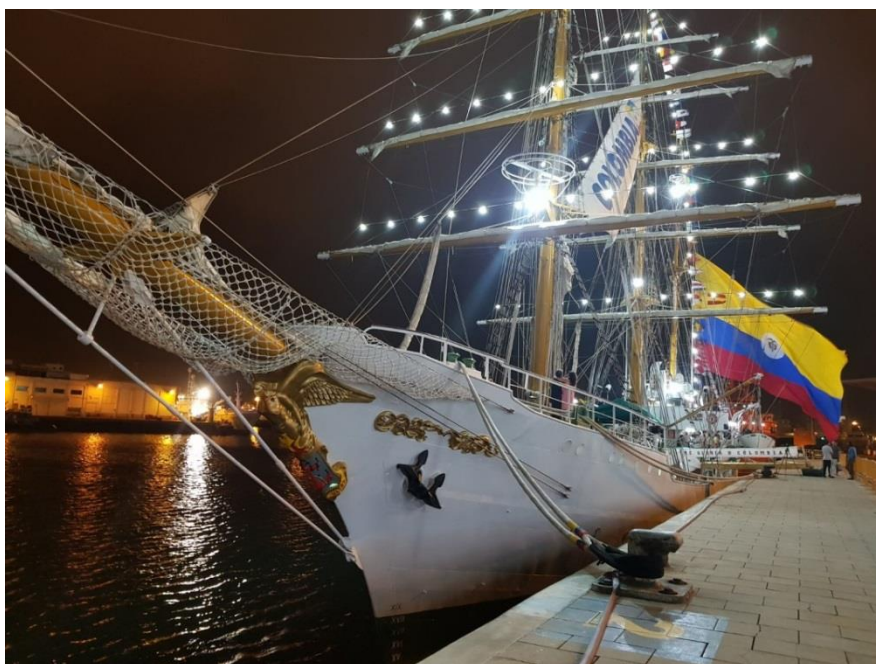
El buque en Las Palmas

El ARC Gloria también sirvió de escenario para que los representantes de Procolombia y el Embajador Furmanski detallaran a un grupo de empresarios canarios de los sectores de exportación y turismo, las ventajas y atractivos de nuestro país y resolvieran las principales dudas en cada una de las áreas de interés.